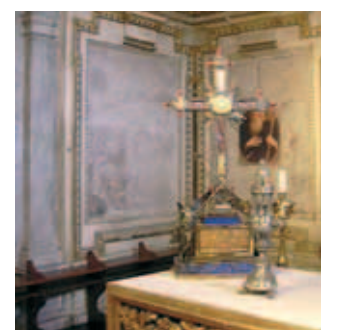
Thánh tích một mẩu Thánh giá bảo tồn trong vương cung thánh đường Thánh giá, Rome