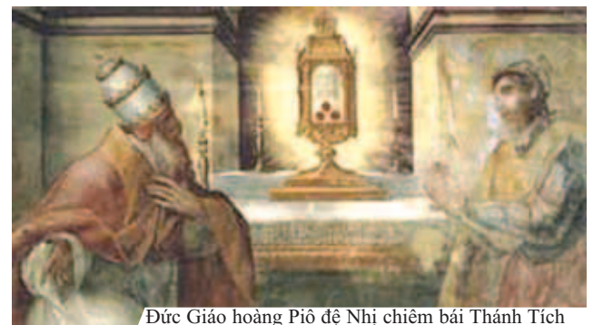
Đức Giáo hoàng Piô đệ Nhị chiêm bái Thánh Tích

Hàng năm một lễ kỷ niệm Phép lạ cử hành ở Weingarten gọi là Cuộc Kiệu Máu Thánh. Có lần trong cuộc Kiệu trọng thể, có gần 3000 xa mã của các người đại diện các giáo xứ khác nhau, và các bậc phẩm trật giáo quyền đã đến tham dự.