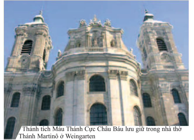
Thánh tích Máu Thánh Cực Châu Báu lưu giữ trong nhà thờ Thánh Martinô ở Weingarten