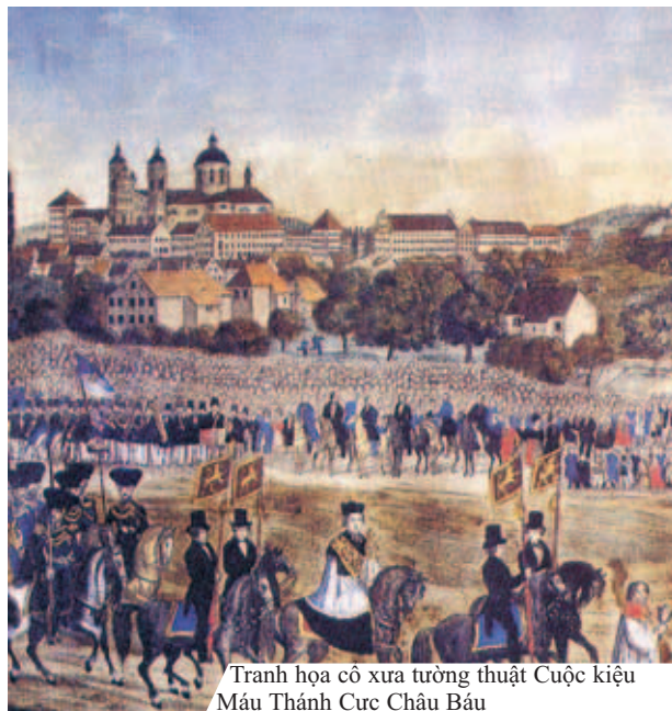
Tranh họa cổ xưa tưởng tượng Cuộc kiệu Máu Thánh Cực Châu Báu