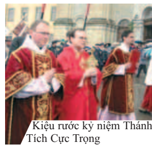
Kiệu rước kỷ niệm Thánh Tích Cực Trọng