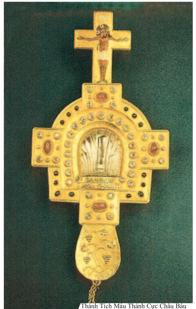
Thánh Tích Máu Thánh Cực Châu Báu