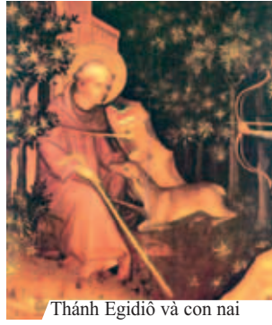
Thánh Edigiô và con nai

Charles Martel mắc tội trọng và rất hối hận. Ông tìm đến tu viện trưởng nổi tiếng vào thời ấy là cha Edigio ở Provenza; để xin được giải tội mà không phải xung thú bọc bạch ra, và vẫn có thể giữ bí mật về tội của mình. Trong khi Thánh Edigio đang dâng Thánh Lễ, khi ấy có một thiên thần hiện ra gần bàn thờ, tay cầm một quyển sách ghi tội lỗi hối nhân chưa nói ra. Trong khi Thánh Lễ tiếp tục được cử hành thì những dòng chữ viết trong sách nhạt màu từ từ, cho đến lúc biến mất hoàn toàn. Lúc ấy Charles cảm thấy tội lỗi của ông đã hoàn toàn được hòa giải.