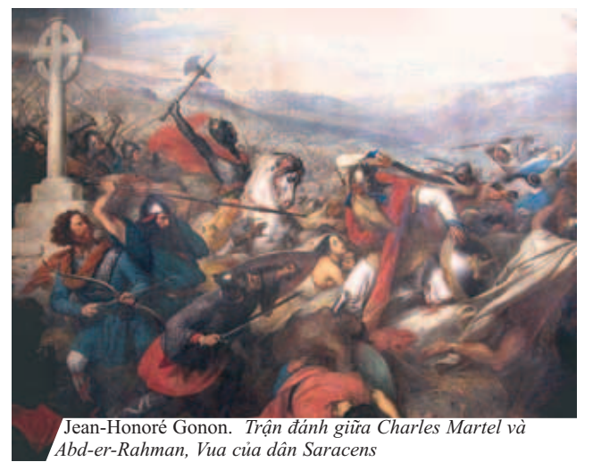
Jean-Honoré Gonon. Trận đánh giữa Charles Martel và Abd-er-Rahman, Vua của dân Saracens

T rước khi ăn mừng chiến thắng quân Saracens ở Poitiers, Charles Martel đã phạm tội loạn luân với em gái. Tuy rất hối hận, ông không dám đi xưng tội lỗi xấu xa ấy. Ông quyết định đi Provenza để gặp vị tu viện trưởng nổi tiếng đương thời là cha Egidio; để xin được giải tội mà không phải xung thú bọc bạch ra, và vẫn có thể giữ bí mật về tội của mình đã phạm. Trong khi Thánh Egidio đang dâng Thánh Lễ, khi ấy một thiên thần hiện ra gần bàn thờ, trong tay cầm một quyển sách ghi tội lỗi mà hối nhân chưa nói ra. Trong khi Thánh Lễ vẫn tiếp tục cử hành thì những dòng chữ viết trong sách nhạt màu từ từ, cho đến lúc biến mất hoàn toàn. Lúc ấy Charles cảm thấy tội lỗi của ông đã hoàn toàn được hòa giải. Thánh Edigio được mọi người biết đến, ngay cả trước khi ngài làm phép lạ này.