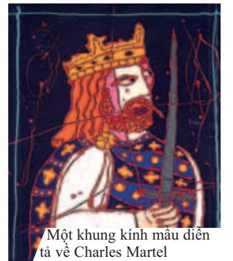
Một khung kính màu diễn tả về Charles Martel