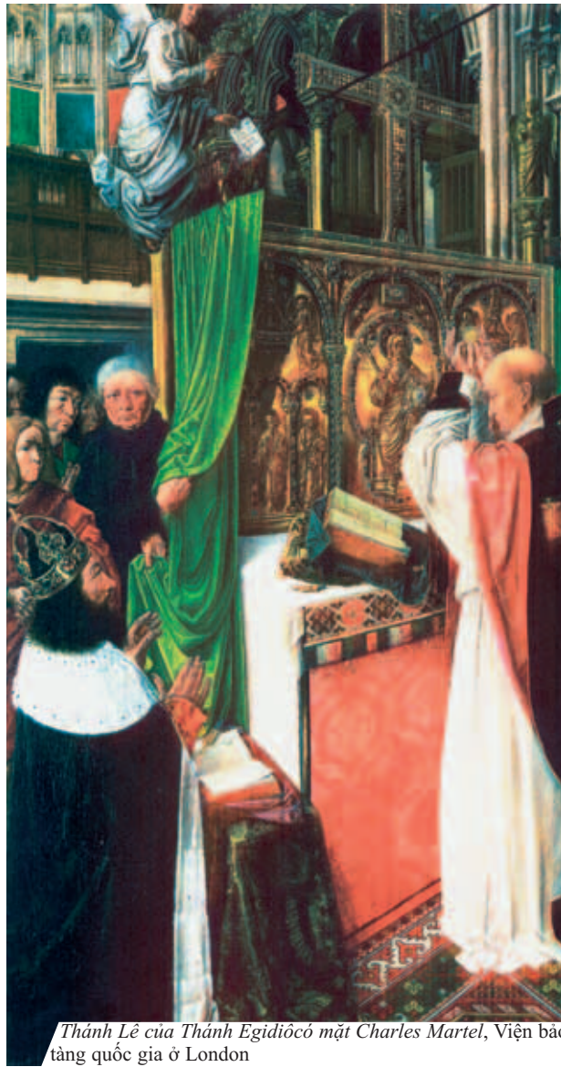
Thánh Lễ của Thánh Edigiô có mặt Charles Martel, Viện bảo tàng quốc gia ở London