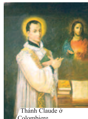
Thánh Claude ở Colombiere