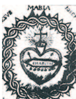
Mẫu hình do Thánh Magarita