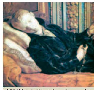
Thánh Stanislaus rước Thánh Thể do thiên thần đưa đến