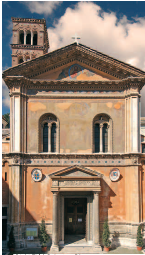
Nhà thờ Thánh Pudenziana, Rôma

Mãi đến ngày nay, ta vẫn có thể thấy được dấu vết kỳ diệu do Thánh Thể rơi trên bậc thềm bàn thờ trong nhà nguyện Caetani, thuộc nhà thờ Thánh Pudenziana ở Rôma. Dấu in để lại trên bậc thềm của Thánh Thể rơi từ tay một linh mục; vì ngài đã hồ nghi về Sự Hiện Diện Thực Sự của Chúa Kitô trong Bí tích Thánh Thể trong khi làm Lễ.