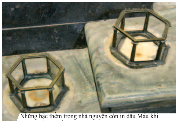
Những bạc thềm trong nhà nguyện còn in dấu Máu khi Thánh Thể rơi xuống