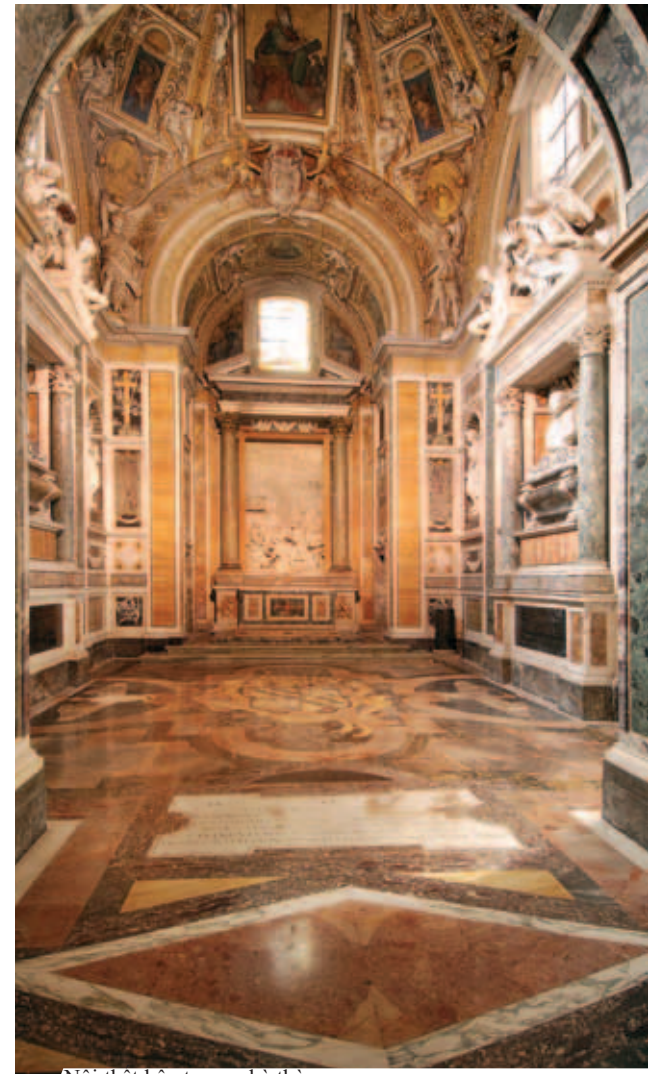
Nội thất bên trong nhà thờ