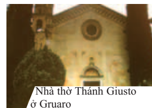
Nhà thờ Thánh Giusto ở Gruaro