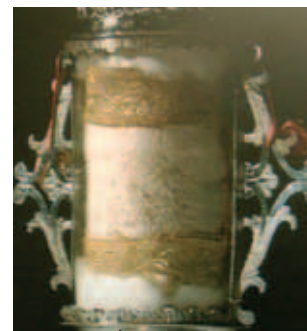
Chi tiết khăn thánh