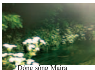
Dòng sông Maira