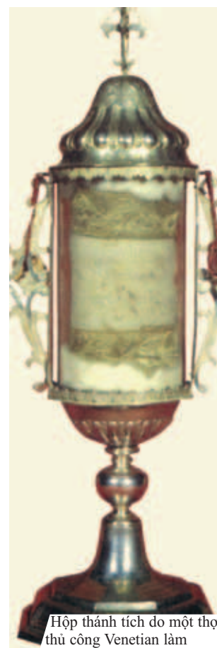
Hộp thánh tích do một thợ thủ công Venetian làm ra năm 1755