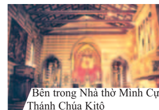
Bên trong Nhà thờ Minh Cực Thánh Chúa Kitô