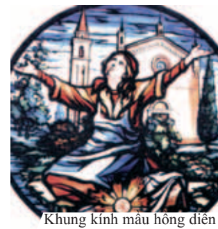
Khung kính màu hồng diển tả Phép lạ