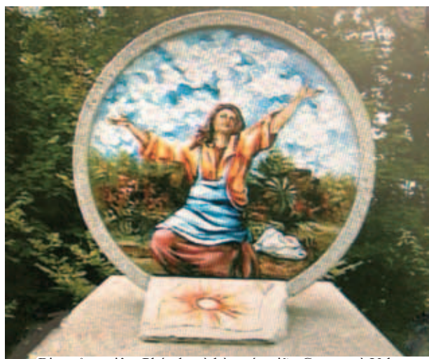
Bia tường niệm Phép lạ và hòa ước giữa Gruaro và Valvasone