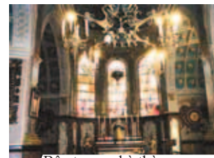
Bên trong nhà thờ