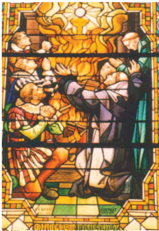
Khung kính màu trong nhà thờ nơi trưng bày Phép lạ

Năm 1608, trong ngày Vọng của Lễ Hiện Xuống, các tu sĩ dòng quyết định tôn trưng Thánh Thể cho giờ Châu phép lành. Đêm hôm ấy, một ngọn lửa bốc lên đốt cháy bàn thờ và các đồ vật thánh, chỉ trừ ra Mặt nhật có giữ Thánh Thể. Vài ngày sau, Mặt nhật này được đem xuống trong lúc còn bay lơ lửng trên không. Minh Thánh Cực Trọng vẫn còn được giữ gìn cho đến hiện nay, và có nhiều tín hữu đi hành hương hàng năm đến Favenerney để chiêm bái Phép lạ.