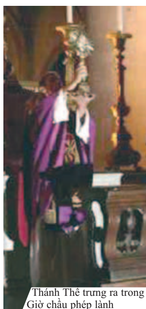
Thánh Thể trưng ra trong Giờ châu phép lành