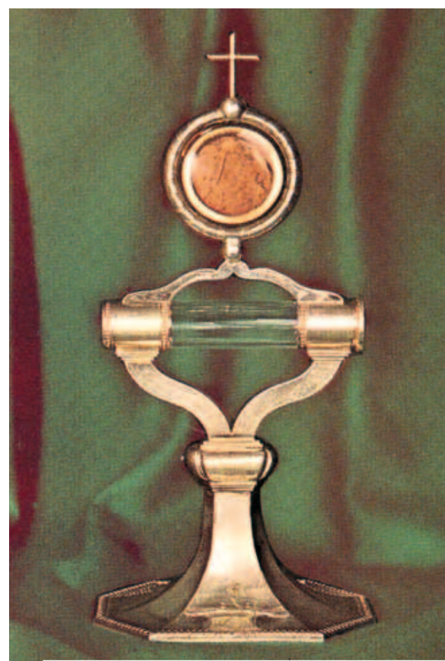
Mặt nhật lưu giữ thánh tích Thánh Thể Phép lạ

Vào khoảng đầu thế kỷ thứ 17, đạo Tin lành và chủ thuyết Calvinist đã tràn lan trong các giới quý tộc và ngay cả trong các phẩm trật của Giáo hội công giáo; vì những hứa hẹn vật chất mà các tôn giáo mới này bảo là sẽ đem lại cho họ. Việc này làm lung lay đức tin của nhiều người, và ảnh hưởng đến cả những tu viện. Rất nhiều tu sĩ đã rời bỏ Dòng Biển Đức ở thành phố Favenerney, vì họ không tuân theo các quy luật nghiêm ngặt của dòng. Tuy nhiên người ta cũng còn sùng mộ vào Đức Bà La Blanche và đến nhà thờ ấy để cầu nguyện, nơi được mọi người trong vùng đều biết qua các phép lạ kỳ tích xảy ra từ trước. Qua sự cầu bầu của Đức Bà, có nhiều phép lạ được xác nhận. Chẳng hạn như phép lạ làm sống lại hai trẻ nhỏ chưa được rửa tội. Năm 1608, trong ngày Vọng của Lễ Hiện Xuống, các tu sĩ dòng quyết định chuẩn bị bàn thờ để