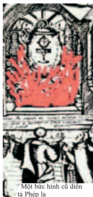
Một bức hình cũ diễn tả Phép lạ