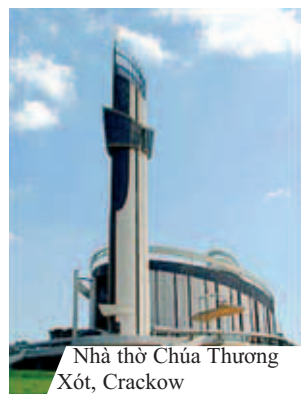
Nhà thờ Chúa Thương Xót, Cracow