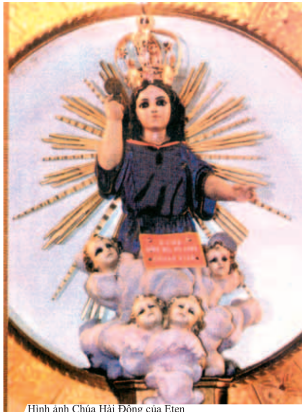
Hình ảnh Chúa Hải Đồng của Eten

Phép lạ Thánh Thể ở Eten xảy ra cách đây 365 năm, tại thành phố Port Eten thuộc xứ Péru. Khi phép lạ xảy ra, Chúa Giêsu Hải Đồng và ba quả tim màu trắng sáng ngời nổi liền nhau, đã hiện ra trong Thánh Thể đang tôn trung cho mọi người chiêm bái. Từ đó dân Eten tổ chức đại lễ kỷ niệm biến cố Phép Lạ Thánh Thể hàng năm bắt đầu từ ngày 12 tháng 7, trong dịp này dân chúng cung nghinh Thánh Thể từ Đài thánh đến nhà thờ chánh tòa Eten, và ngày lễ chấm dứt vào ngày 24 tháng 7.