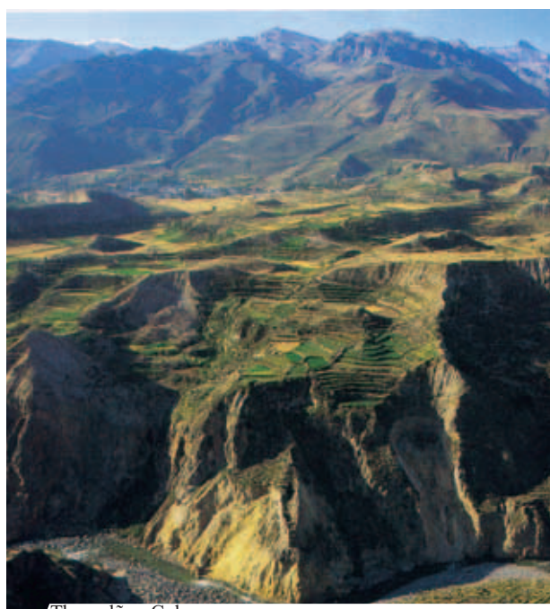
Thung lũng Colca