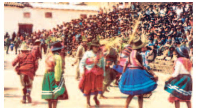
Đại lễ mừng kỷ niệm Chúa Hải Đồng