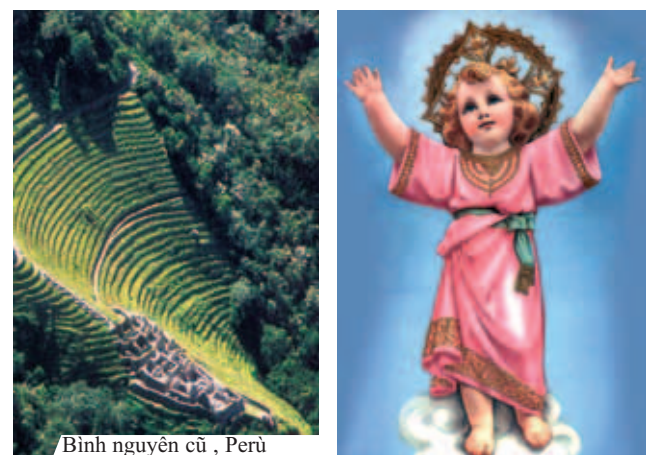
Bình nguyên cũ, Peru