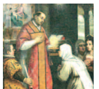
Thánh Catarina hay thấy một Hải nhi thay vào chỗ Thánh Thể ở trong tay linh mục; có khi thánh nữ thấy một lò lửa cháy lớn, cũng giống như linh mục đi trong đó, khi bà rước Lễ. Sưu tầm của Fresco trong Viện bảo tàng Hiéron, Paray-le-Monial.

Chúa Giêsu đã tin thác những lời này với thánh nữ Catarina Siena khi nói về Thánh Thể: “Con nhận được hết tất cả ơn thiêng liêng của Bí tích diệu ngọt nhất qua tấm bánh trắng. Cũng giống như mặt trời không thể bị chia ra, Thiên Chúa và Con Người không thể tách ra trong màu trắng trong của Thánh Thể. Giả sử Minh Thánh có thể phân ra được: mặc dù có thể chia Thánh Thể ra thành hàng nghìn mảnh nhỏ, trong mỗi mảnh nhỏ ấy đều có sự hiện diện của Chúa Kitô, với toàn Thiên Tính và Nhân tính. Cũng giống như khi một tấm kính vỡ ra hàng nghìn mảnh; Thánh Thể sẽ không bị bể vụn, hoặc tách rời hình ảnh của Thiên Chúa và Con Người trong mỗi phần nhỏ con thấy trong Thánh Thể. Hình ảnh Thiên Chúa và Con Người đều có trong mỗi phần nhỏ. Khác với lửa, hình ảnh của Minh Thánh