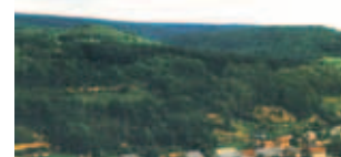
Phong cảnh thành phố Blanot