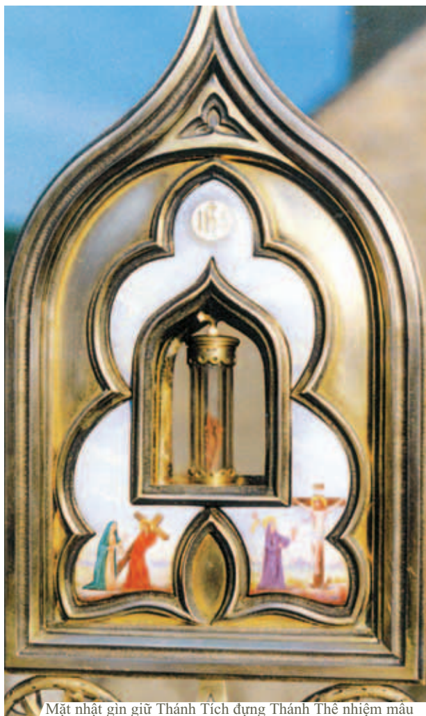
Mặt nhật gìn giữ Thánh Tích đựng Thánh Thể nhiệm mầu

Phép Lạ Thánh Thể Blanot xảy ra vào Thánh Lễ Phục sinh năm 1331. Khi một giáo dân lên rước Lễ, một Mình Thánh rớt xuống mảnh khăn dùng để hứng dưới cằm. Linh mục không gỡ Mình Thánh ra khỏi khăn ấy được dù đã tìm mọi cách. Mình Thánh trở nên Máu tươi và để lại dấu vết có cùng kích thước của Mình Thánh lên chiếc khăn. Mảnh khăn ấy vẫn còn được lưu giữ ở Blanot.