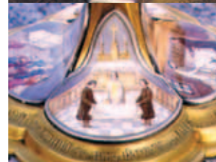
Chi tiết tranh họa trang hoàng trên Mặt nhật