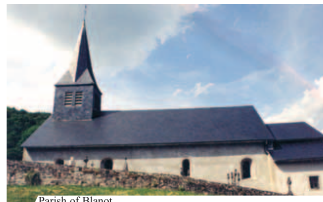
Parish of Blanot