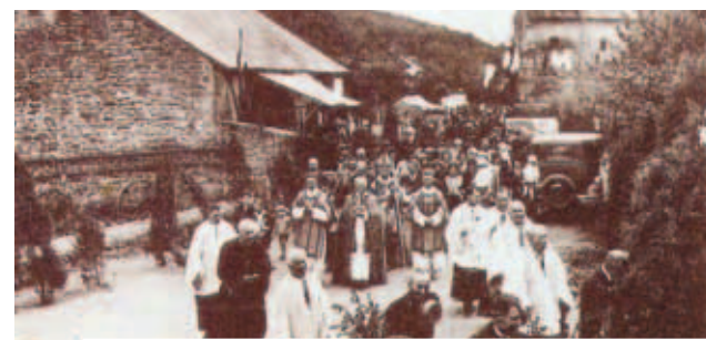
Cuộc kiệu rước kỷ niệm Phép lạ