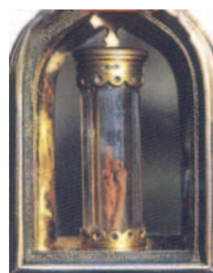
Ông pha lê đựng mảnh vải nhuộm Máu, trong hộp triển lãm có từ thế kỷ 17