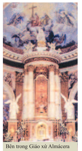
Bên trong Giáo xứ Almería