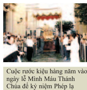
Cuộc rước kiệu hàng năm vào ngày lễ Minh Máu Thánh Chúa để kỷ niệm Phép lạ