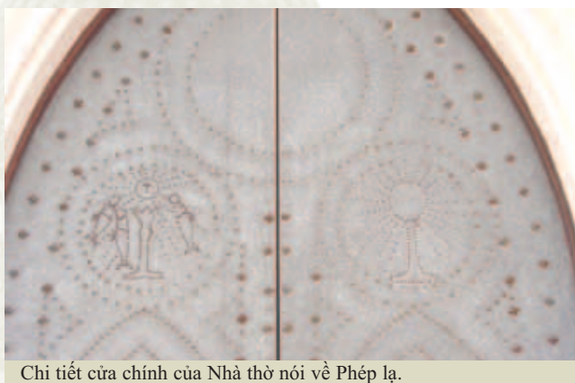
Chi tiết cửa chính của Nhà thờ nói về Phép lạ.