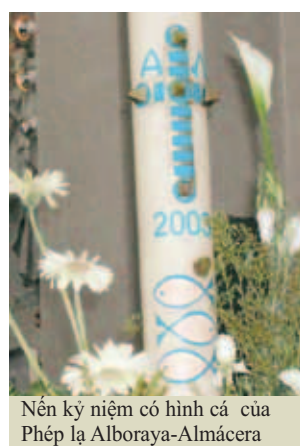
Nền kỷ niệm có hình cá của Phép lạ Alboraya-Almería