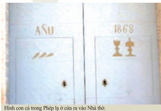
Hình con cá trong Phép lạ ở cửa ra vào Nhà thờ.