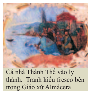
Cá nhà Thánh Thể vào ly thánh. Tranh kiểu fresco bên trong Giáo xứ Almería