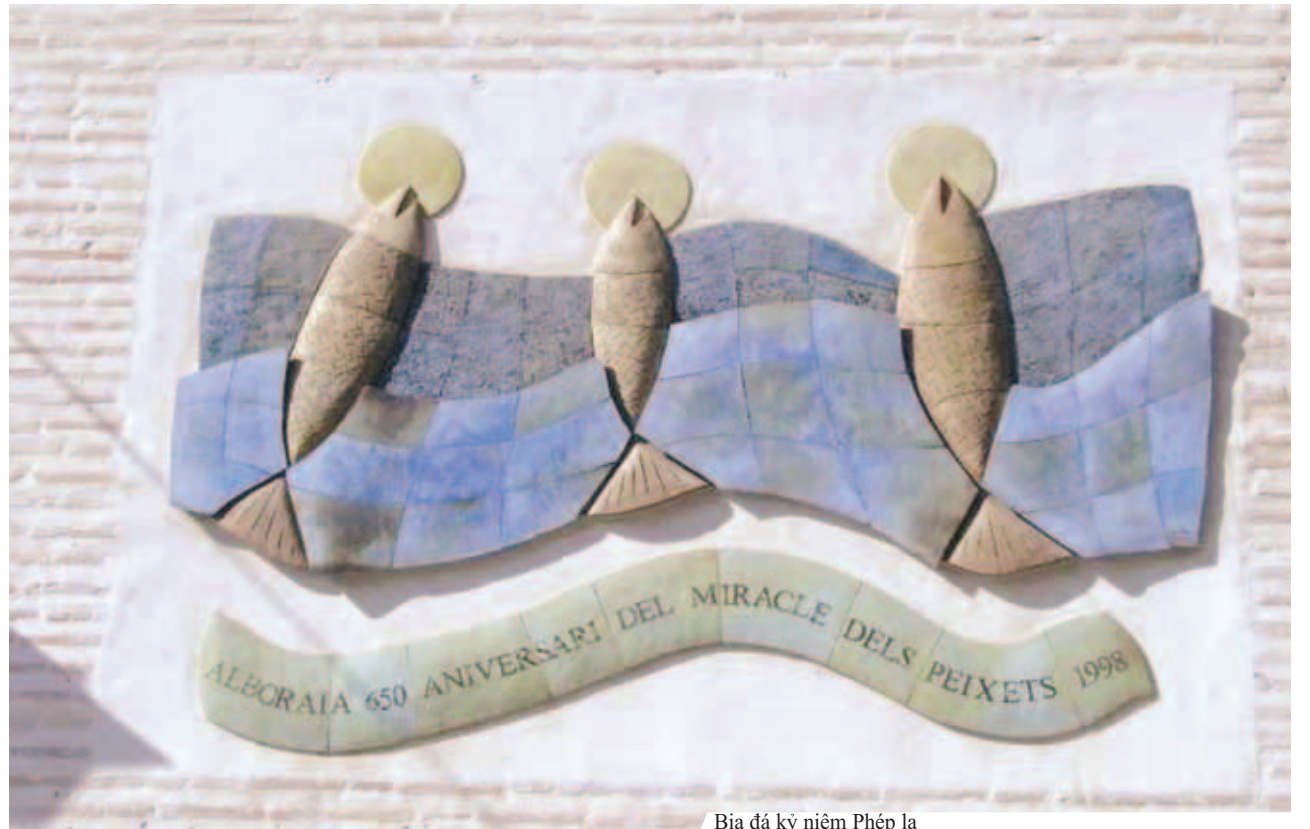
Bia đá kỷ niệm Phép lạ

Linh mục vui mừng vô hạn khi thấy ba con cá kỳ lạ vẫn còn ở tại chỗ người ta chỉ. Chúng ngậm Thánh Thể trong miệng và đứng thẳng lên, hầu như vươn cao lên trên mặt nước, trông giống như ba chiếc cúp trao giải thưởng nhỏ nhắn.