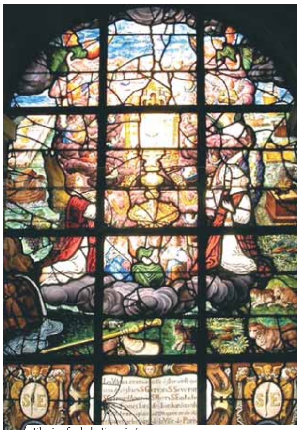
El triunfo de la Eucaristía