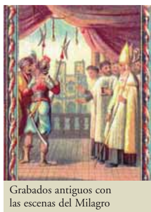
Grabados antiguos con las escenas del Milagro