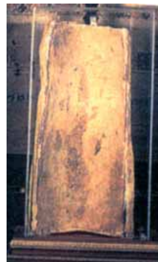
Teja donde sucedió el Milagro, Offida