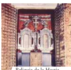
Reliquia de la Hostia