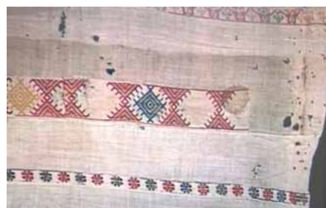
Detalle del lino ensangrentado