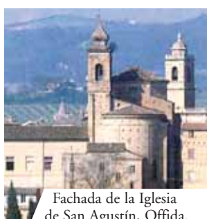
Fachada de la Iglesia de San Agustín, Offida.