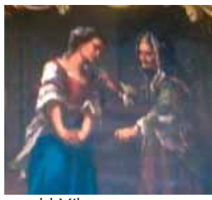
Frescos de la iglesia con imágenes del Milagro