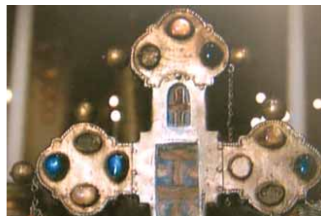
Imagen ampliada de la reliquia de la Hostia, contenida en la preciosa Cruz, obra de un orfebre veneciano (siglo XIII)