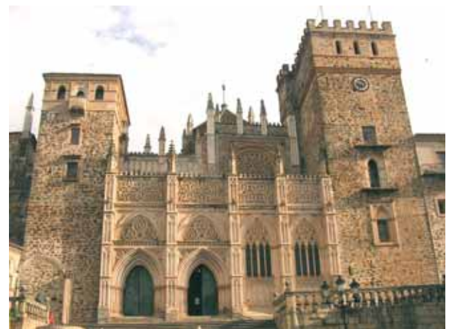
Iglesia de Nuestra Señora de Guadalupe