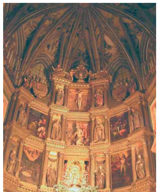
Retablo de la Virgen de Guadalupe

H oy en día, en el Santuario de Guadalupe de la región de Toledo, es todavía posible admirar las preciosas Reliquias del Corporal y el Palio ensangrentado (el Palio es una pequeña tela cuadrada, almidonada, que sirve para cubrir el cáliz y la patena). Estos fueron utilizados durante la Misa milagrosa por el Venerable Padre Pedro Cabañuelas, sacerdote de profunda devoción eucarística. Transcurría horas enteras en adoración, sea de noche como de día, delante del Santísimo Sacramento. Durante un período, fue duramente tentado acerca de la realidad de la transustanciación; pero en 1420 todas sus dudas fueron disipadas. Como era costumbre cotidiana, el padre Pedro se dispuso a la celebración de la Santa Misa. En el momento de la consagración vio una densa nube que impedía la visibilidad y bajaba de lo alto para posarse finalmente sobre el altar. Entonces,