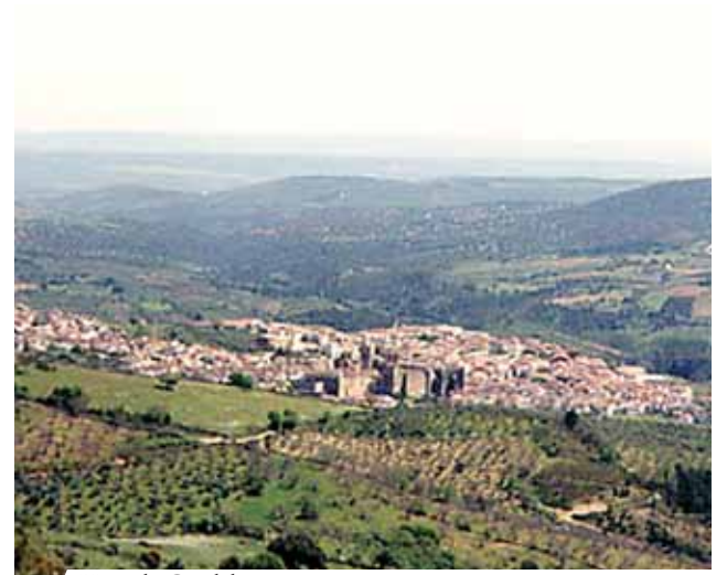
Vista de Guadalupe