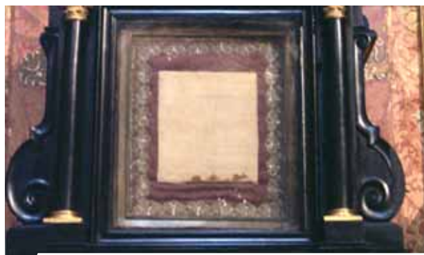
Reliquia del corporal bañado en Sangre