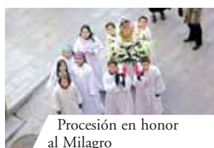
Procesión en honor al Milagro