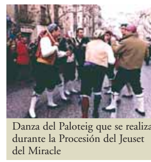
Danza del Paloteig que se realiza durante la Procesión del Jeuset del Miracle