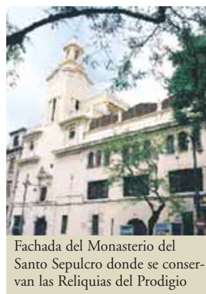
Fachada del Monasterio del Santo Sepulcro donde se conservan las Reliquias del Prodigio