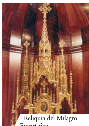
Reliquia del Milagro Eucarístico

El Milagro Eucarístico sucedido en Alcoy en el año 1568, se manifestó gracias a un hallazgo milagroso de algunas Hostias que habían sido robadas. El Prodigio es recordado cada año por los habitantes de Alcoy con una gran fiesta que se celebra en ocasión del Corpus Domini. La casa del sacrílego fue transformada en un oratorio, que sigue siendo visitado hasta el día de hoy.