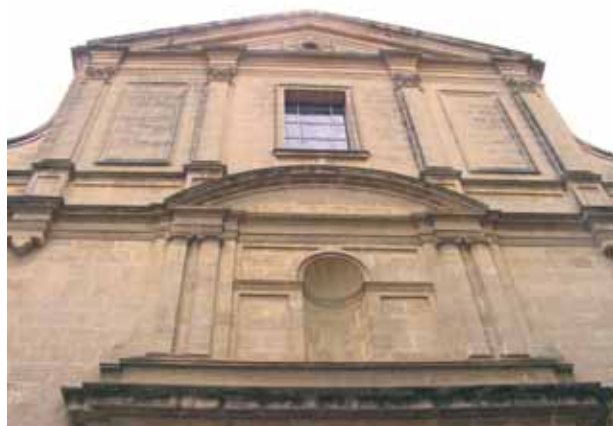
Iglesia construida sobre el lugar donde sucedió el Milagro