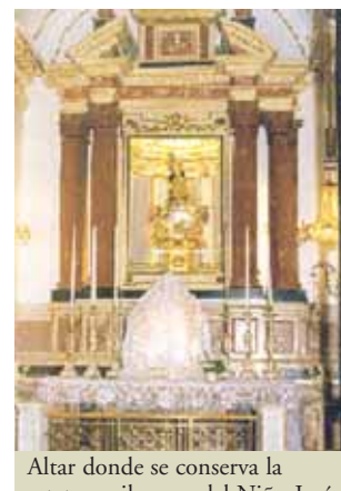
Altar donde se conserva la estatua milagrosa del Niño Jesús