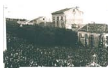
Процессия в Морровалле в честь чуда