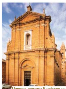
Церковь святого Варфоломея

В 1560 году в Морровалле в результате страшного пожара была уничтожена церковь францисканцев, однако при этом уцелела большая Гостия, находившаяся в дароносице (которая тоже сгорела вся, кроме крышки). В 1960 году праздновалась четырехсотлетняя годовщина этого евхаристического чуда, и Городской совет единодушно решил поместить на главных воротах Морровалле надпись Civitas Eucaristica («Город Евхаристии»).