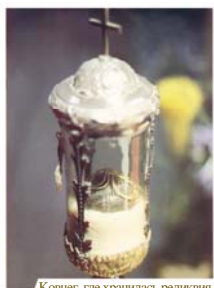
Ковчег, где хранилась реликвия