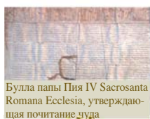
Булла папы Пия IV Sacrosanta Romana Ecclesia, утверждающая почитание чуда