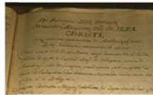
Заверенная копия декреталии Николая V от 1454 года, в которой папа позволяет графам Вальвазоне оставить у себя реликвию при условии, что они построят храм в честь Тела Христова

Один из наиболее авторитетных документов, описывающих евхаристическое чудо 1294 года в Груаро, принадлежит перу местного историка Антонио Николетти (1765). Женщина стирала в общественной прачечной Версиола литургические покровы из церкви св. Джусто и вдруг заметила, что на полотне появились кровавые пятна. Присмотревшись, она увидела, что Кровь изливается из Гостии, оставшейся в складках ткани.