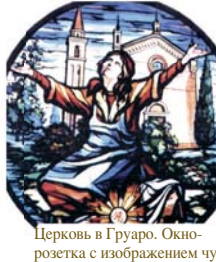
Церковь в Груаро. Окно-розетка с изображением чуда