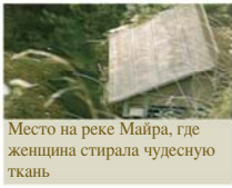
Место на реке Майра, где женщина стирала чудесную ткань