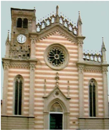
Льняное полотно с пятнами Крови хранится в Вальвазоне, в церкви Святейшего Тела Христова