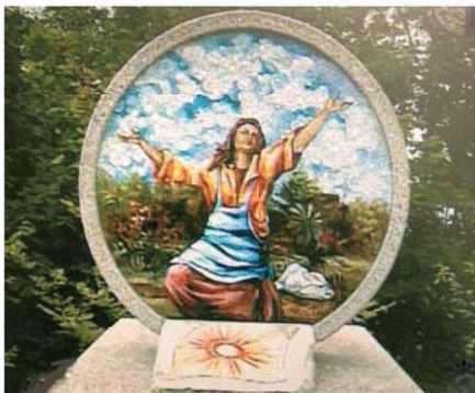
Мемориал, построенный в память о чуде и о примирении между Груаро и Вальвазоне