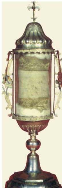
Ковчег, созданный венецианским мастером в 1755 году