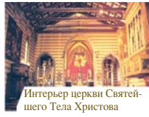
Интерьер церкви Святейшего Тела Христова