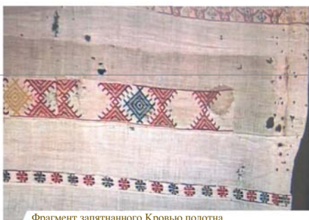
Фрагмент запятнанного Кровьюю полотна