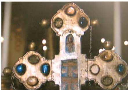
Гостия хранится внутри драгоценного креста, сделанного венецианским мастером (XIII век)