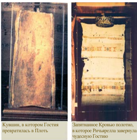
Кувшин, в котором Гостия превратилась в Плоть