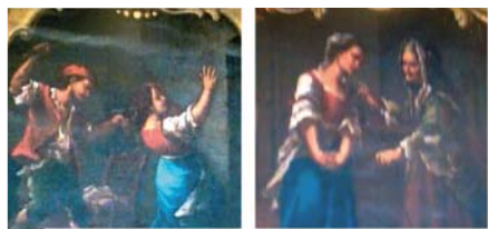
Церковные фрески, изображающие чудо