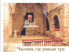
Часовня, где раньше хранились чудесные реликвии