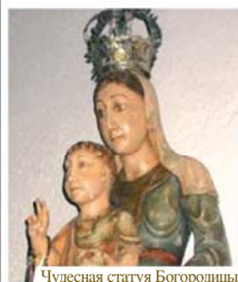
Чудесная статуя Богородицы