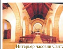
Интерьер часовни Санта-Мария