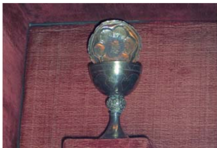
Ковчег с чашей, патеной и Святой Кровью