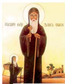
Св. Моисей, монах-пустыльник