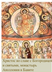
Христос во славе с Богородицей и святыми, монастырь Аполлония в Бавите