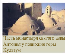
Часть монастыря святого аввы Антония у подножия горы Кульзум