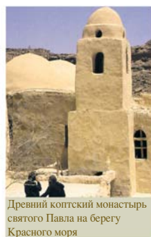
Древний коптский монастырь святого Павла на берегу Красного моря