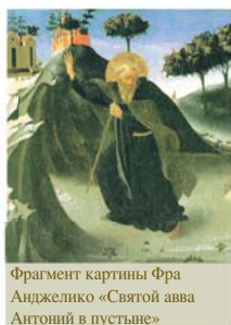
Фрагмент картины Фра Анджелико «Святой авва Антоний в пустыне»