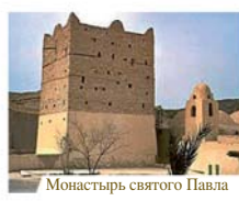
Монастырь святого Павла