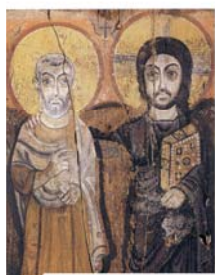
Христос обнимает авву Мена (VI век)