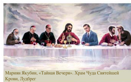
Мариан Якубин, «Тайная Вечеря». Храм Чуда Святейшей Крови, Лудбрег