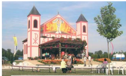
Храм Чуда Святейшей Крови, Лудбрег