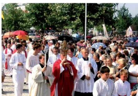
Ежегодная сентябрьская процессия в ходе праздника Sveta Nedilja, отмечаемого в память о чуде