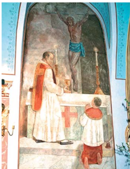
Фреска, на которой представлена сцена чуда