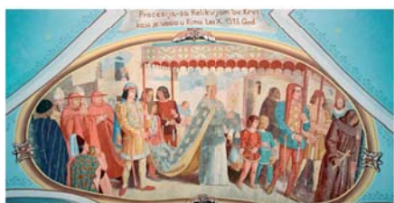
Фреска с изображением процессии в Риме в 1513 году, когда папа Лев X пронес святыню по улицам города