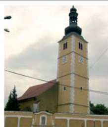
Часовня в замке семьи Баттъяни, где произошло чудо