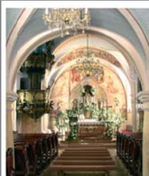
Интерьер часовни в замке Баттъяни

В 1411 году во время Мессы в Лудбреге священник усомнился, действительно ли Тело и Кровь Христа присутствуют в Евхаристии. После освящения Даров Вино превратилось в Кровь. В наши дни эта святая реликвия по-прежнему привлекает тысячи паломников, а каждый год в начале сентября празднуется так называемая Sveta Nedilja – недельное торжество в честь евхаристического чуда 1411 года.