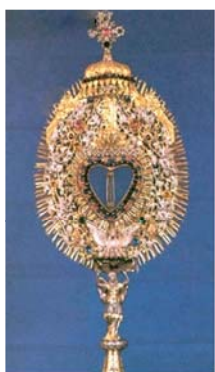
Выполненная в серебре и золоте дароносица 1719 года с чудесной Святейшей Кровью