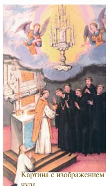
Картина с изображением чуда

Маленькая деревня Св. Георгенберг-Фихт в долине реки Инн знаменита тем, что в 1310 году здесь произошло евхаристическое чудо. Во время Мессы священник усомнился в истинном присутствии Иисуса в Святых Дарах. После освящения Вино превратилось в Кровь, закипело и излилось из чаши. В 1480 году, 170 лет спустя, Святая Кровь, по словам летописца того времени, «все еще оставалась свежей, словно только что вышедшей из раны». Она хранится до сегодня в особом ковчеге, который находится в монастыре св. Георгенберга.