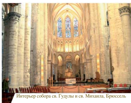
Интерьер собора св. Гудулы и св. Михаила, Брюссель