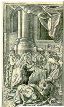
Старинные печатные изображения чуда