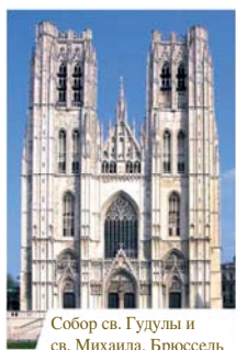
Собор св. Гудулы и св. Михаила, Брюссель

В Брюссельском соборе хранится множество художественных свидетельств евхаристического чуда, случившегося в 1370 году. Злоумышленники похитили Гостии и оскверняли их, протыкая ножами. Из Гостий истекла живая Кровь. Память об этом чуде праздновалась до середины XX века. Для хранения чудесных Гостий в разные эпохи было создано множество ковчегов. Сейчас они находятся возле собора, в музее, расположенном в старинной часовне. Чудо запечатлено также на гобеленах XVIII века.