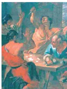
«Евхаристическое чудо в Брюсселе». Musée Héron, Паре-ле-Мониаль