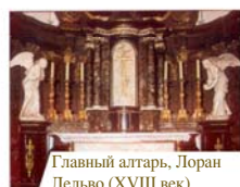
Главный алтарь, Лоран Дельво (XVIII век)