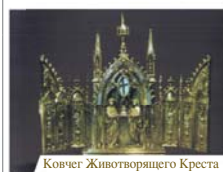
Ковчег Животворящего Креста