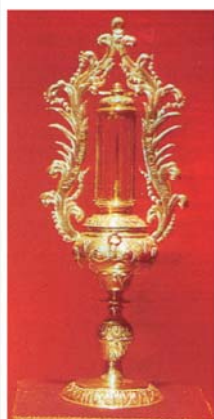
Ковчег с шипом из тернового венца Иисуса