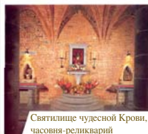
Святителище чудесной Крови, часовня-реликварий