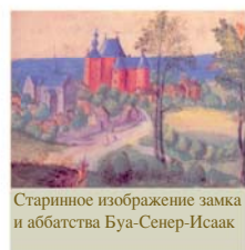
Старинное изображение замка и аббатства Буа-Сенер-Исаак