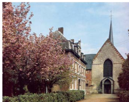
Аббатство ордена премонстрантов, часовня Святейшей Крови

В Буа-Сенер-Исаак из освященной Гостии истекла Кровь, запятнавшая корпорал. 3 мая 1413 года Пьер д'Эйи, епископ Камбре, утвердил почитание этого чуда и посвященную ему торжественную процессию. Первая процессия прошла в 1414 году. 13 января 1424 года папа Мартин V одобрил строительство монастыря Буа-Сенер-Исаак. Сегодня монастырь является центром паломничества, а корпорал с пятнами Крови выставляется для поклонения в часовне.