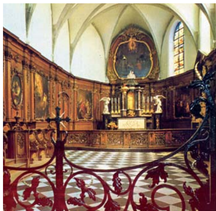
Хоры часовни Святейшей Крови