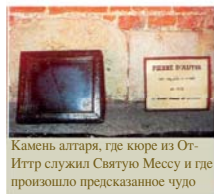
Камень алтаря, где кюре из От-Иттр служил Святую Мессу и где произошло предсказанное чудо