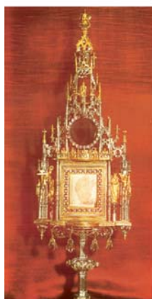
Ковчег с чудесным корпоралом, запятнанным Кровью

В Буа-Сенер-Исаак из освященной Гостии истекла Кровь, запятнавшая корпорал. 3 мая 1413 года Пьер д'Эйи, епископ Камбре, утвердил почитание этого чуда и посвященную ему торжественную процессию. Первая процессия прошла в 1414 году. 13 января 1424 года папа Мартин V одобрил строительство монастыря Буа-Сенер-Исаак. Сегодня монастырь является центром паломничества, а корпорал с пятнами Крови выставляется для поклонения в часовне.