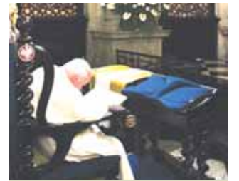
João Paulo II instituiu no ano 2000 a festa litúrgica da Divina Misericórdia a ser celebrada todos os anos no segundo domingo de Páscoa.

Jesus diz a Santa Faustina: "Minha Filha, ajuda-me a salvar um pecador em agonia, reza por ele o terço que eu te ensinei". Quando comeci a rezar o terço vi aquele moribundo entre lutas e tormentos atrozes. O seu anjo da guarda estava defendendo-o, mas ele era impotente diante da grande miséria daquela alma. Uma multidão de demônios esperava por ela; enquanto eu rezava o terço vi Jesus com o aspecto que está pintado na imagem. Os raios que saíam do Coração de Jesus envolveram o enfermo e os poderes das trevas fugiram fazendo muito barulho. O doente expirou serenamente. Quando caí em mim compreendi que este terço é importante para os moribundos, ele aplaca a ira de Deus." (Santa Faustina Kowalska, Diário )