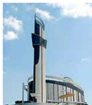
Santuário da Divina Misericórdia, Cracóvia