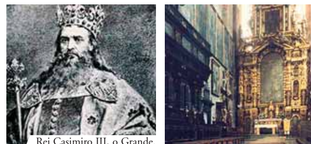
Rei Casimiro III, o Grande.