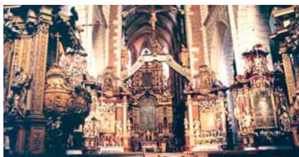
Interior da Igreja do Corpus Christi, Cracóvia.