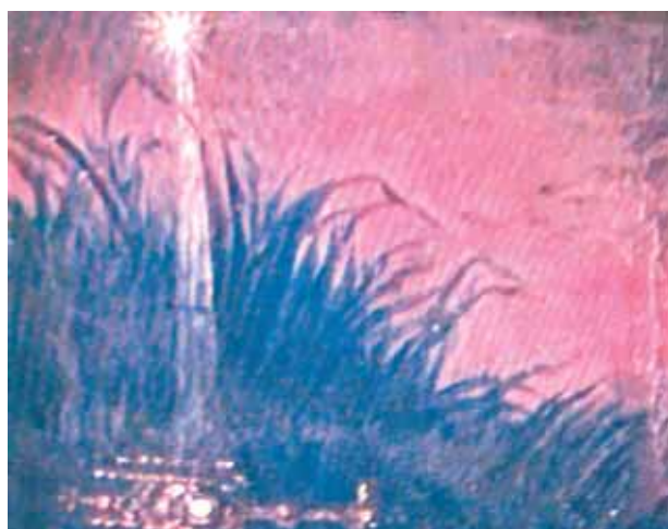
Detalhe da pintura.