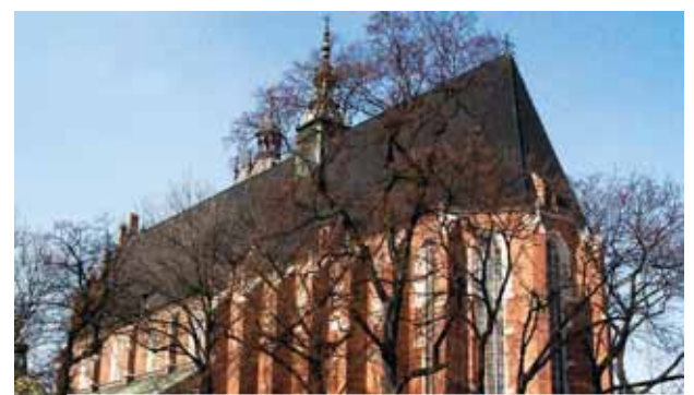
Igreja do Corpus Christi.

No ano de 1345, o rei da Polônia Casimiro III, o Grande, mandou construir uma igreja dedicada ao Corpo de Cristo em memória do Milagre Eucarístico que ocorreu naquele mesmo ano nos campos de Wawel, perto de Cracóvia.