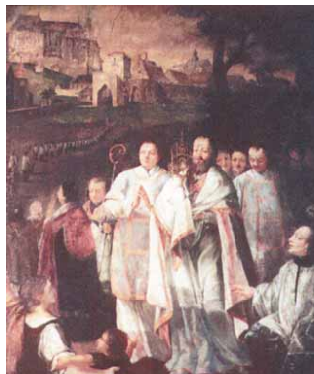
Este quadro mostra a procissão que o Bispo e os cidadãos fizeram depois que as Hóstias Milagrosas foram encontradas no pântano.

Todo o pântano foi revistado e finalmente um homem achou a Píxide com as Hóstias dentro; elas estavam completamente intactas e emanavam uma luz ofuscante. O povo comovido começou a louvar o Senhor e a celebrar o Milagre. Ainda hoje, por ocasião da Festa de Corpus Christi, se comemora o Milagre na Igreja do Corpo de Cristo em Cracóvia.