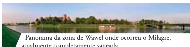
Panorama da zona de Wawel onde ocorreu o Milagre, atualmente completamente saneada.