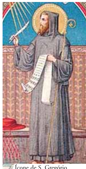
Ícone de S. Gregório