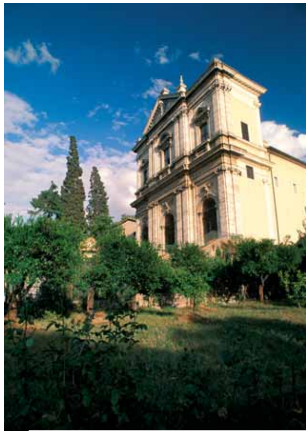
Igreja de S. Gregório Magno no Célio, Roma