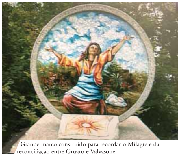
Grande marco construído para recordar o Milagre e da reconciliação entre Gruario e Valvasone