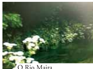
O Rio Maira