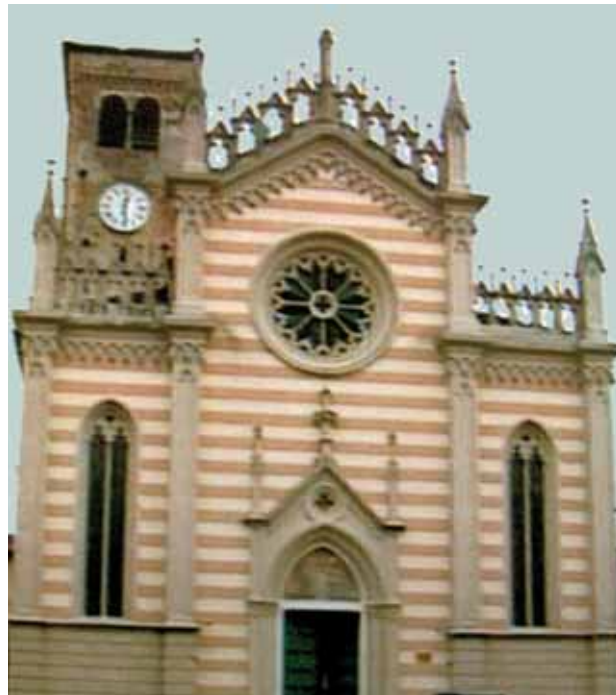
Na Igreja do SS. Corpo de Cristo em Valvasone, está conservada a toalha de linho ensanguentada

Entre os documentos mais importantes que descrevem este Milagre Eucarístico acontecido em Gruario no ano de 1294, está a do historiador local António Nicoletti (1765). Uma mulher estava a lavar num lavadouro, construído ao longo do canal de irrigação de Versiola, uma das toalhas do altar da Igreja de S. Justo. Inesperadamente, viu o linho da toalha tingir-se de sangue. Observando mais atentamente, notou que o sangue provinha de uma Partícula Consagrada que ficara entre as pregas da toalha.