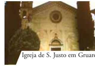
Igreja de S. Justo em Gruario