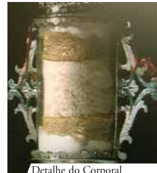
Detalhe do Corporal