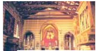
Interior da Igreja do SS. Corpo de Cristo