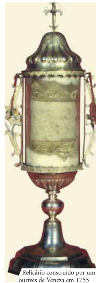
Relicário construído por um ourives de Veneza em 1755