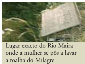
Lugar exacto do Rio Maira onde a mulher se pôs a lavar a toalha do Milagre