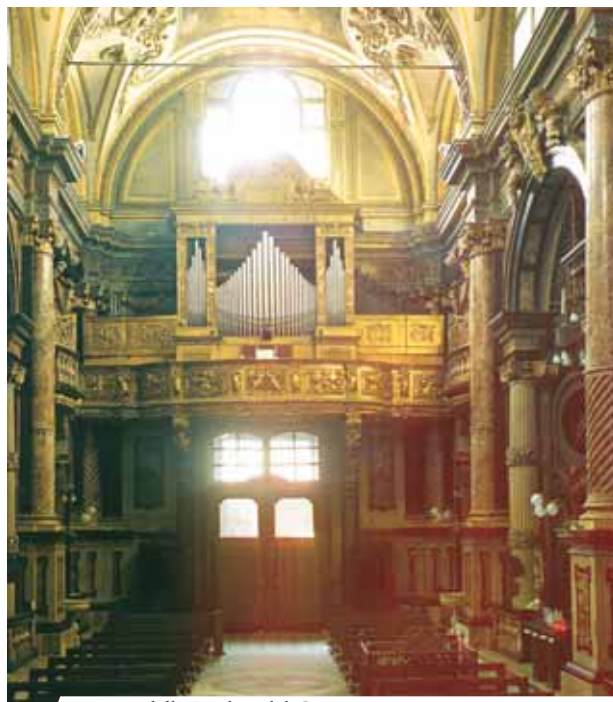
Interno della Basilica del Corpus Domini

Nella Basilica del Corpus Domini a Torino, si trova una cancellata in ferro che racchiude il luogo dove si verificò il primo Miracolo Eucaristico avvenuto a Torino nel 1453. Un'iscrizione sul pavimento all'interno della cancellata descrive il Prodigio: «Qui cadde prostrato il giumento che trasportava il Corpo divino - qui la Sacra Ostia liberatasi dal sacco che l'imprigionava, si levò da se stessa in alto - qui clemente discese nelle mani supplici dei Torinesi - qui dunque il luogo fatto santo dal Prodigio - ricordandolo, pregando genuflesso ti sia in venerazione o ti incuta timore (6 giugno 1453)».