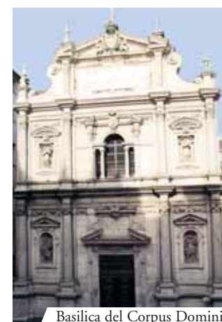
Basilica del Corpus Domini, Torino