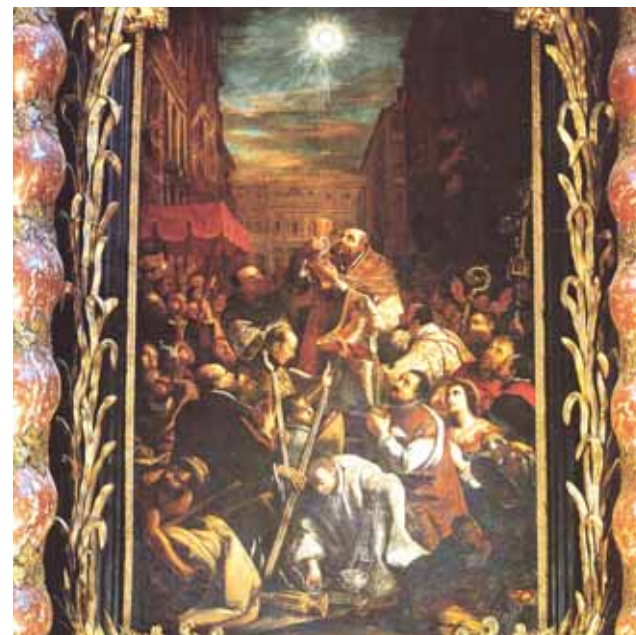
Entrando nella Basilica del Corpus Domini a Torino, si nota subito sopra l'altare un quadro, del pittore Bartolomeo Garavaglia, discepolo del Guercino, che raffigura il grande Miracolo Eucaristico del 1453.