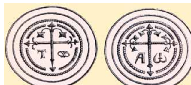
Impronte dell' Ostia del Miracolo

Nell'Alta Val Susa, presso Exilles, le truppe di Renato d'Angiò si scontrarono con le milizie del duca Lodovico di Savoia. Qui i soldati si abbandonarono al saccheggio del paese ed alcuni entrarono in chiesa. Uno di loro, forzò la porticina del tabernacolo e rubò l'ostensorio con l'Ostia consacrata. Avvolse tutta la refurtiva in un sacco e a dorso di mulo, si diresse verso la città di Torino. Sulla piazza maggiore, presso la chiesa di S. Silvestro, ora dello Spirito Santo, sul luogo dove in seguito fu eretta la chiesa del Corpus Domini, il giumento incespì e cadde. Ecco allora aprirsi il sacco e l'ostensorio con l'Ostia consacrata elevarsi al di sopra delle case circostanti tra lo stupore della gente. Tra i presenti c'era anche Don Bartolomeo Coccolo, il quale corse a dar notizia al Vescovo, Lodovico dei marchesi di Romagnano. Il Vescovo, accompagnato da un