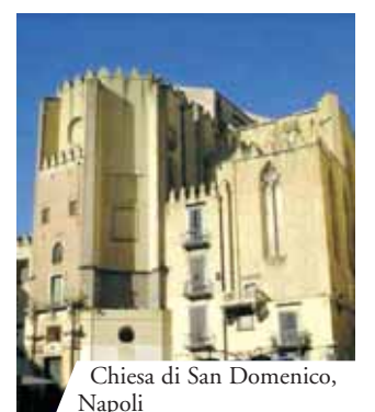
Chiesa di San Domenico, Napoli

San Tommaso durante il suo secondo professorato a Parigi si ritrovò nel bel mezzo di una disputa tra i professori dell'Università de la Sorbonne, circa il Sacramento dell'Eucaristia. Se da una parte, infatti, i sensi percepiscono la presenza degli «accidenti»: colore, sapore, durezza, quantità, estensione nei concreti pane e vino eucaristici; dall'altra la fede afferma che nel Sacramento è presente il Corpo e il Sangue di Cristo, portando ad una apparente contraddizione. I teologi parigini erano divisi in due schieramenti circa la constatazione oggettiva e la valutazione della Fede. Decisero di interrogare San Tommaso, perché già altre volte avevano potuto sperimentare la sua intelligenza filosofica e la santità teologica. Gli chiesero quindi di pronunciarsi, in quanto la sua sentenza teologica sarebbe diventata normativa. Misero dunque