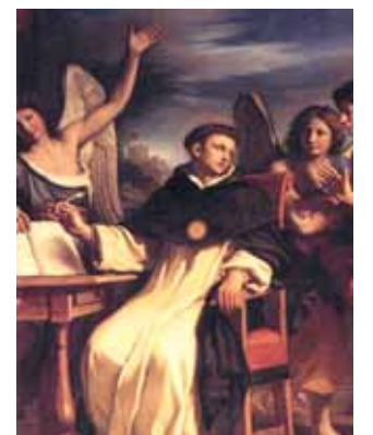
G. Francesco Barbieri, detto il Guercino, S. Tommaso d'Aquino scrive assistito dagli Angeli (1662)