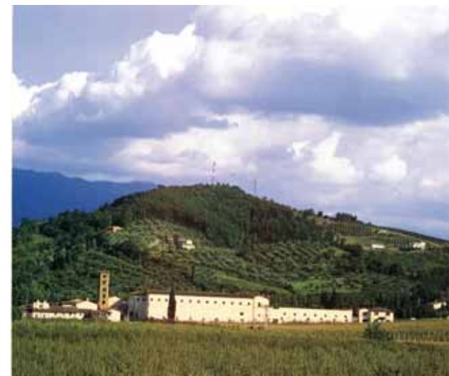
Secondo un'iscrizione settecentesca posta sulla facciata della chiesa, l'Abbazia di S. Maria di Rosano fu fondata nel 780