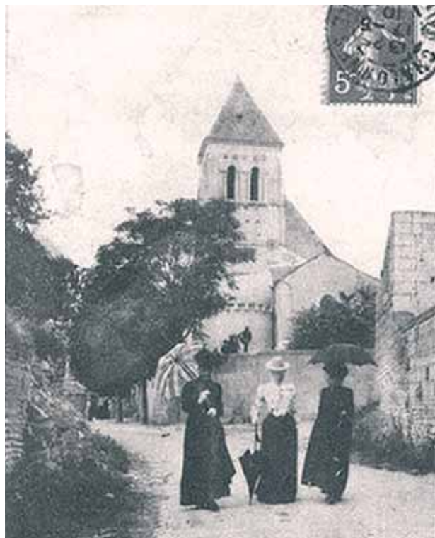
Chiesa parrocchiale di Les Ulmes