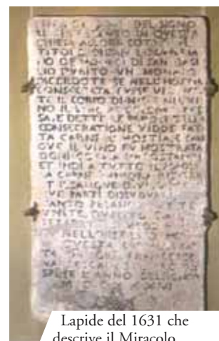
Lapide del 1631 che descrive il Miracolo