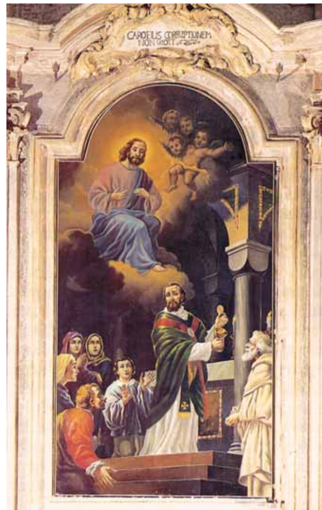
Dipinto presente nella cappella Valsecca che raffigura il Miracolo