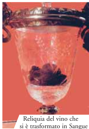
Reliquia del vino che si è trasformato in Sangue