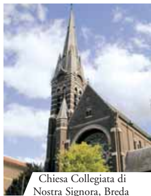
Chiesa Collegiata di Nostra Signora, Breda