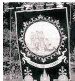
Stendardo raffigurante il ritrovamento dell'Ostia del Miracolo