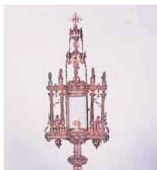
Artistico Ostensorio in cui veniva portata in processione l'Ostia miracolosa, Breda