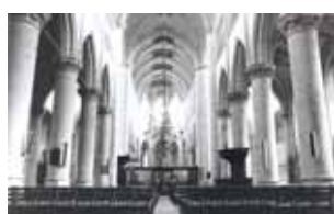
Interno della Chiesa