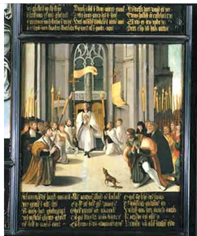
La Reliquia dell'Ostia del Prodigio viene portata in processione (1535), Museo Sacro di Breda

Prodigio Eucaristico. Dopo alterne vicissitudini, nel XX secolo il culto è stato solennemente ripristinato da una Confraternita di Breda dedicata al Santissimo Sacramento. Ancora oggi, ogni anno, durante la festa del Corpus Domini, si tengono processioni e preghiere pubbliche in onore del Prodigio.