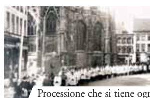
Processione che si tiene ogni anno in onore del Prodigio