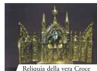
Reliquia della vera Croce