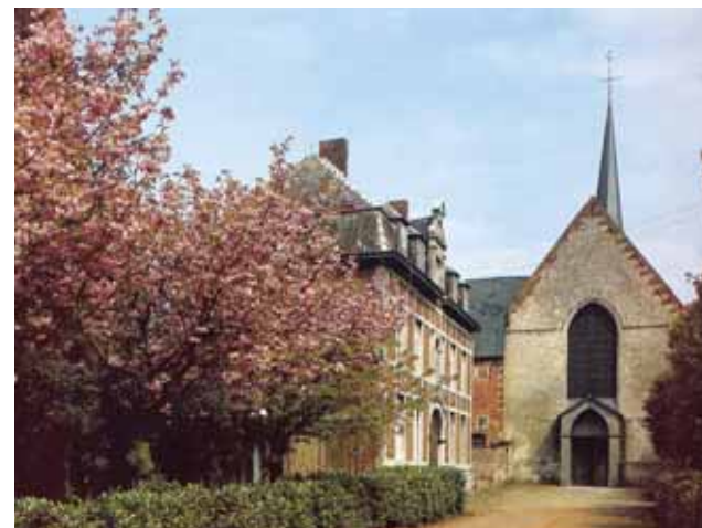
Abbazia Premostratense, Cappella del Santo Sangue