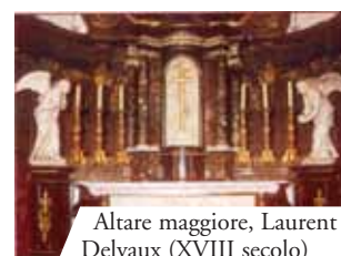
Altare maggiore, Laurent Delvaux (XVIII secolo)