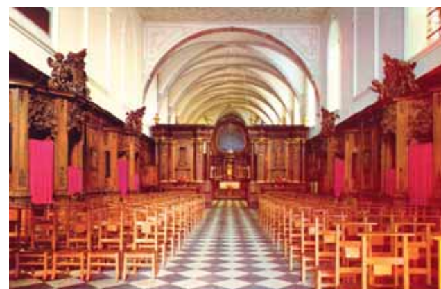
Interno della Cappella del Santo Sangue