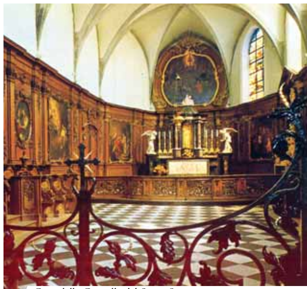
Coro della Cappella del Santo Sangue

Nel Miracolo Eucaristico di Bois-Seigneur-Isaac, l'Ostia consacrata sanguinò e macchiò il Corporale della Messa. Il 3 maggio del 1413, il Vescovo di Cambrai, Pierre d'Ailly, autorizzò il culto della Sacra Reliquia del Miracolo. La prima processione si tenne nel 1414. Il 13 gennaio del 1424, il Papa Martino V, approvò ufficialmente l'erezione del Monastero di Bois-Seigneur-Isaac. Ancora oggi il Monastero è meta di pellegrinaggi, e nella sua Cappella è possibile venerare la Sacra Reliquia del Corporale macchiato di Sangue.