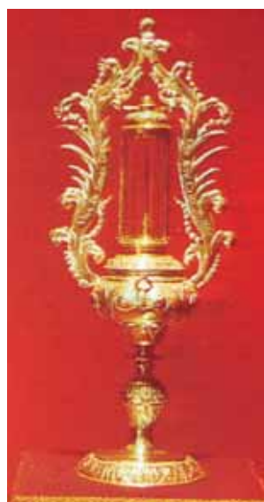
Reliquia di una spina della corona di Gesù