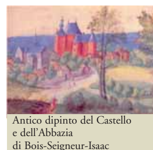
Antico dipinto del Castello e dell'Abbazia di Bois-Seigneur-Isaac