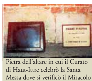
Pietra dell'altare in cui il Curato di Haut-Ittre celebrò la Santa Messa dove si verificò il Miracolo