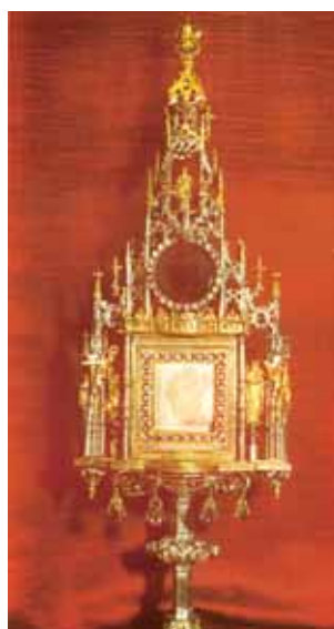
Reliquia del Miracolo Eucaristico, il Corporale macchiato di Sangue