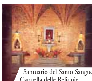
Santuario del Santo Sangue, Cappella delle Reliquie