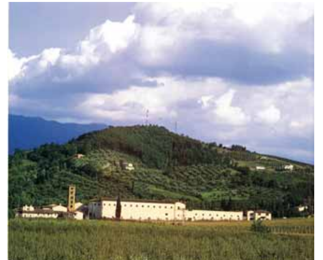
Eine Inschrift besagt, dass die Abtei von S. Maria di Rosano im Jahre 780 gegründet wurde