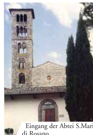
Eingang der Abtei S. Maria di Rosano