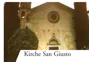
Kirche San Giusto