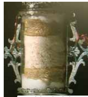
Detail der Altardecke