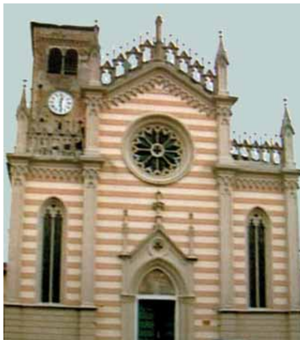
In der Kirche Allerheiligster Körper von Christus in Valvasone wird die blutbefleckte Altardecke aufbewahrt