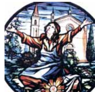
Rosettenglasfenster der Kirche von Gruaro