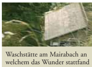
Washstätt am Mairabach an welchem das Wunder stattfand