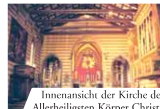
Innenansicht der Kirche des Allerheiligsten Körper Christi