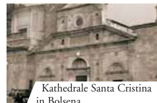
Kathedrale Santa Cristina in Bolsena