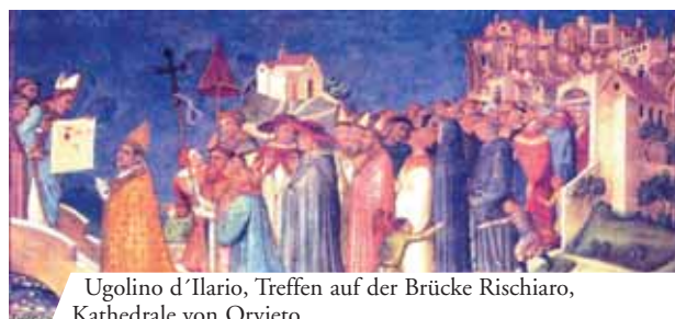
Ugolino d'Ilario, Treffen auf der Brücke Rischiaro, Kathedrale von Orvieto