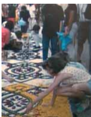
Festlichkeiten zu Ehren des Wunders