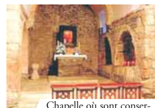
Chapelle où sont conservées les Reliques du Prodiges