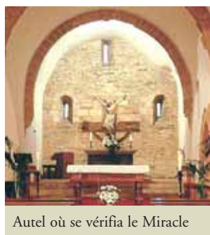
Autel où se vérifia le Miracle