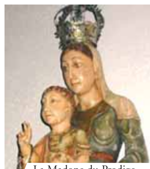
La Madone du Prodiges