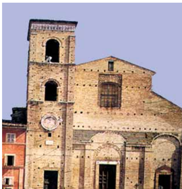
Cathédrale de Macerata

Le 25 Avril 1356, à Macerata un prêtre au nom inconnu célébrait la Messe dans l'église Sainte-Catherine appartenant aux Bénédictines. Pendant la fraction du pain, avant la Communion, le prêtre commença à douter de la présence réelle de Jésus dans l'Hostie consacrée. Pendant qu'il rompait l'Hostie, à sa grande frayeur, il vit jaillir un flot de sang qui tacha une partie du linge et du calice posés sur l'autel.