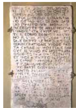
Pierre tombale de 1631 qui décrit le Miracle