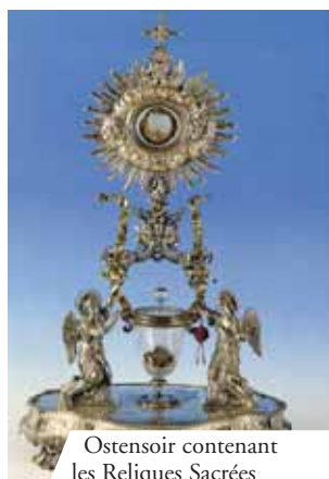
Ostensoir contenant les Reliques Sacrées

« Un moine prêtre douta de la présence du corps de Notre Seigneur dans l'Hostie consacrée. Il célébra la Messe et, après avoir prononcé les paroles de la consécration, il vit l'Hostie se transformer en Chair et le Vin en Sang. Tous les présents assistèrent à cet événement. La Chair est encore entière et le Sang est divisé en cinq parties inégales ayant le même poids aussi bien unies que chacune séparément. »