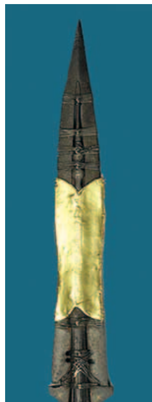
Thánh tích một Lưỡi Đòng mà lính La Mã dùng đâm vào cạnh sườn Chúa Giêsu