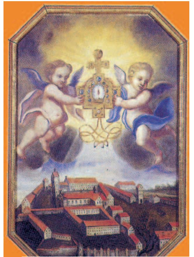
Bửu Huyết Cực Thánh (thê kỷ 17) Văn phòng hành chính thành phố Weingarden.