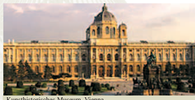
Kunshistorisches Museum, Vienna