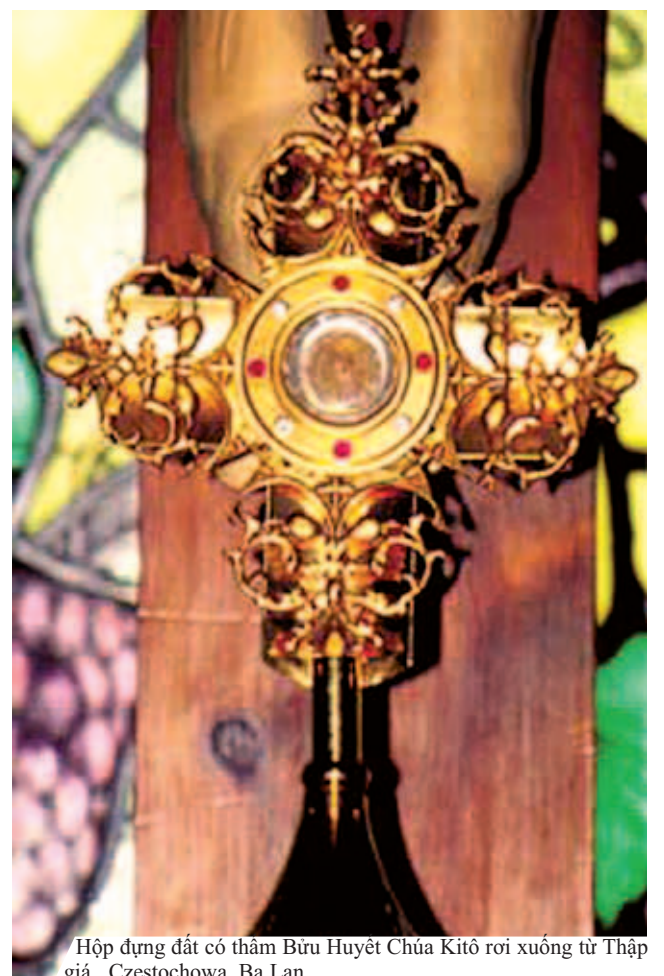
Hộp đựng đất có thắm Bửu Huyết Chúa Kitô rơi xuống từ Tháp giá, Czestochowa, Ba Lan