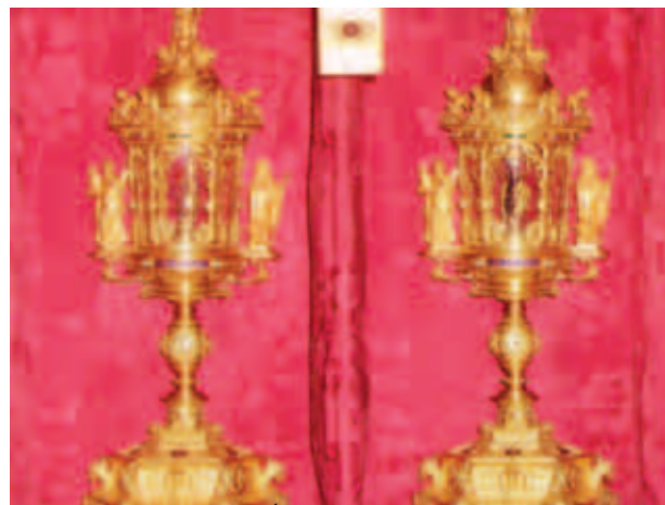
Thánh Tích Bửu Huyết Cực Thánh, Mantua