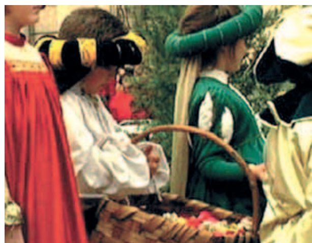
Cuộc rước kiệu kỷ niệm Máu Cực Thánh ở Mantua