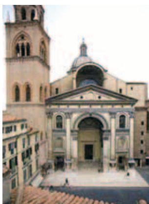
Di tích Máu Thánh Cực Châu Báu bảo tồn trong vương cung thánh đường Thánh Andrea ở Mantua