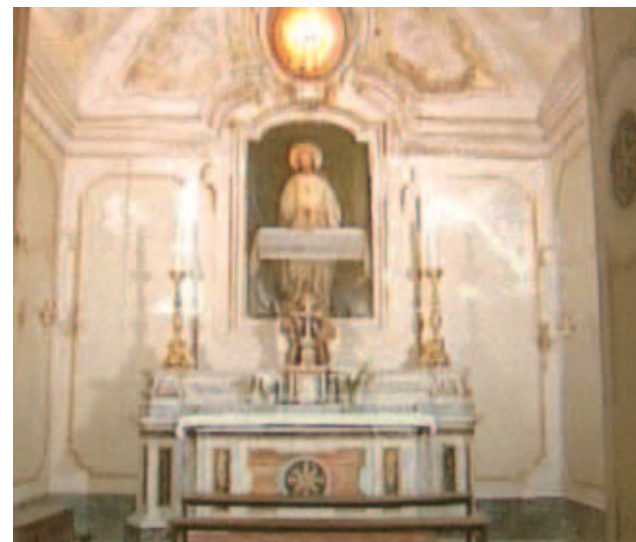
Nhà nguyện nơi có việc hiện ra

ngôi sao thật sáng ở chân ly, trên ngôi sao này là Thánh Thể lớn như Bánh cha dâng Lễ. Ngôi sao gắn vào Thánh Thể(...) Có những đứa trẻ giống thiên thần nhỏ châu chung quanh Thánh Thể..."Ngày nay, biển cổ kỳ diệu được tưởng niệm với lễ trọng thể có mặt Đức Giám mục.