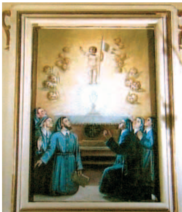
Tranh họa cổ miêu tả Phép lạ

Ngày nay, chiếc Ly thánh này vẫn còn lưu giữ trong nhà thờ Thánh Erasmus, và mỗi năm một lần, được dùng trong Thánh lễ của ngày Thứ ba Phục sinh.