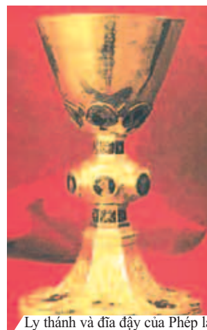
Ly thánh và đĩa đậy của Phép lạ