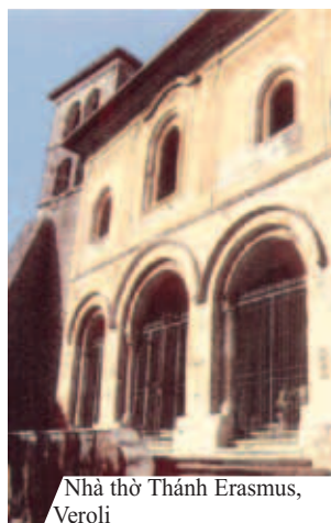
Nhà thờ Thánh Erasmus, Veroli