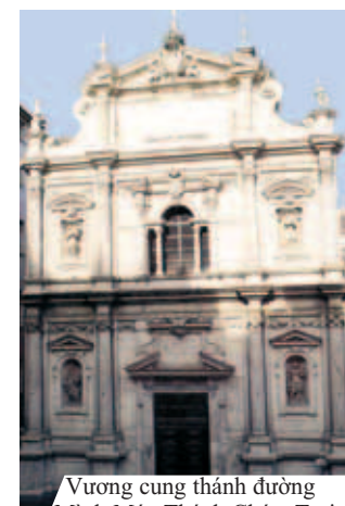
Vương cung thánh đường Minh Máu Thánh Chúa, Turin