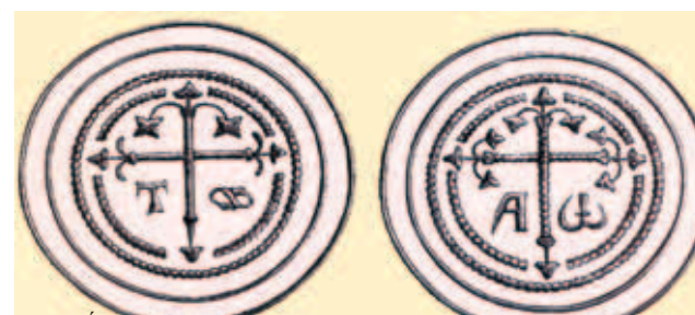
Dấu in Thánh Thể phép lạ