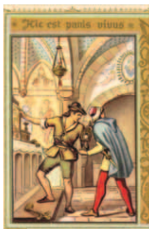
Tranh miêu tả phép lạ Turin