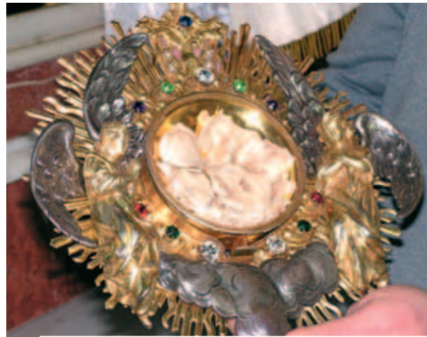
Minh Thánh Phép lạ

Phép lạ Thánh Thể ở Silla xảy ra vào năm 1907. Thánh Thể bị lấy trộm đã tìm lại được, dấu dưới một tảng đá trong một khu vườn nhỏ không xa thành phố, và Thánh Thể vẫn còn tinh nguyên. Ngày nay chúng ta còn có thể chiêm ngắm Thánh Thể còn tồn tại như mới sau hơn 100 năm, trong thành phố này ở ven biển Valencia. Những Thánh Thể này được gìn giữ tại nhà thờ Đức Mẹ của các Thiên thần ở Silla. Cho đến ngày nay, Thánh Thể vẫn không bị hư hoại.