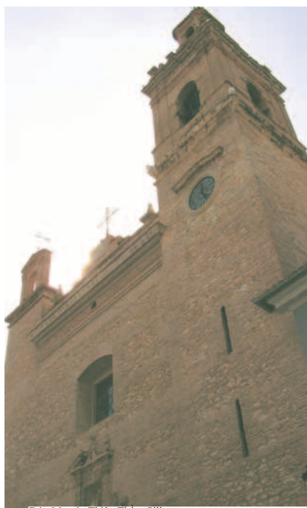
Đức Mẹ các Thiên Thần, Silla