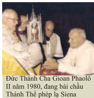
Đức Thánh Cha Gioan Phaolô II năm 1980, đang bái châu Thánh Thể phép lạ Siena