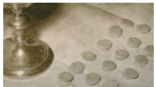
Đã có tất cả 14 cuộc khảo nghiệm để xác nhận tình trạng của Thánh Thể. Thí nghiệm khoa học nổi bật nhất là thí nghiệm theo lời yêu cầu của Thánh Piô X năm 1914, có nhiều khoa học gia tham dự.