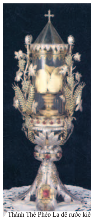
Thánh Thể Phép Lạ để rước kiệu