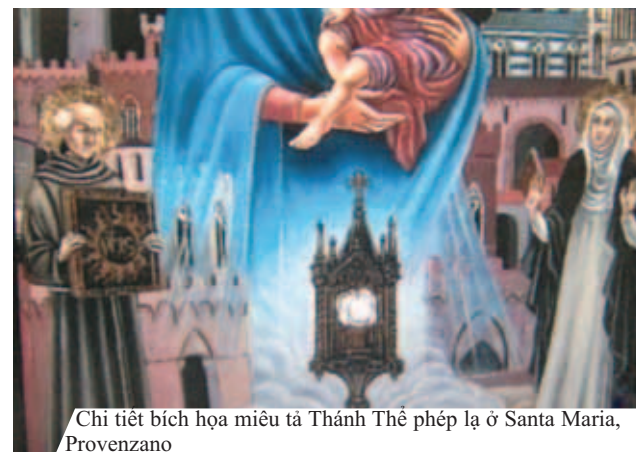
Chi tiết bích họa miêu tả Thánh Thể phép lạ ở Santa Maria, Provenzano