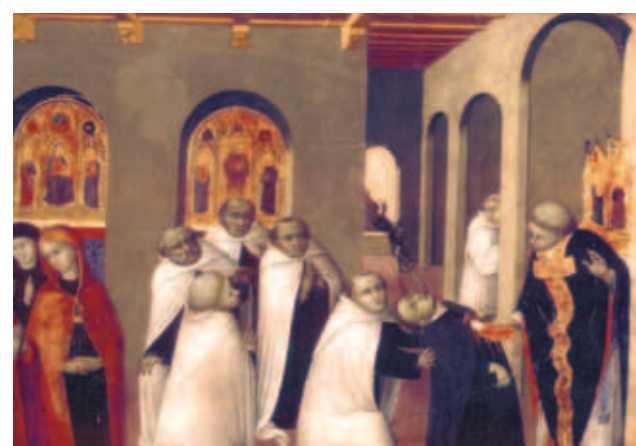
Tranh họa do họa sư Stefano di Giovanni, hay là, “il Sasatta,” được tàng trữ ở viện bảo tàng Bowes trong lâu đài Barnard, nước Anh. Tranh họa diễn tả một tu sĩ Dòng Carmêlô bị đẩy vò trong nỗi nghi ngờ về sự Hiện Diện Thực sự của Chúa Giêsu trong Bí tích Thánh Thể, và đã được giải thoát khỏi ma quỷ sau khi rước Lễ.