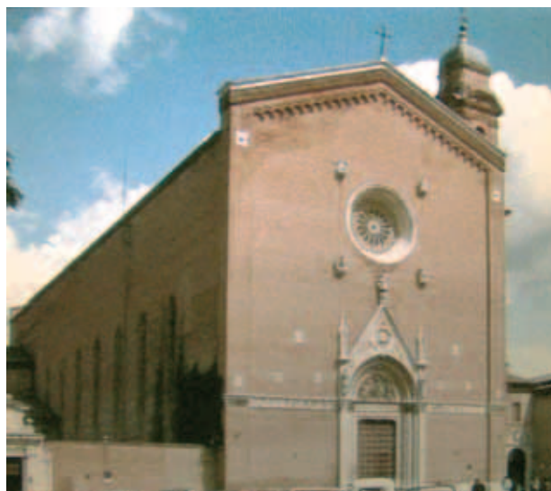
Vương cung thánh đường thánh Phanxicô