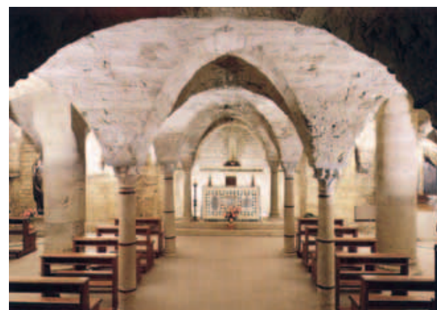
Tầng dưới nhà thờ