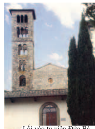
Lối vào tu viện Đức Bà Maria ở Rosano