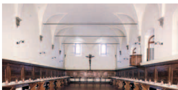
Phòng ăn trong Tu viện