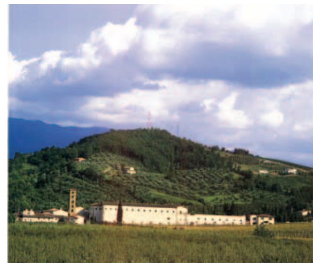
Dựa theo một tấm bảng khắc ở mặt tiền nhà thờ vào thế kỷ 17, Tu viện Đức Thánh Maria ở Rosano đã dựng lên năm 780