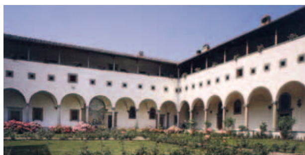
Nhà Dòng kín