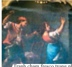
Tranh chạm fresco trong nhà thờ miêu tả Phép lạ

Ở thành phố Offida gần nhà thờ Thánh Augustinô, thánh tích của Phép lạ Thánh Thể năm 1273 về Bánh Thánh biến thành Thịt, vẫn còn được bảo tồn tại đây. Có rất nhiều hồ sơ nói về Phép lạ này, trong đó có bài viết trên một tấm da từ thế kỷ 13, do lục sự Giovanni Battista Doria năm 1788. Ngoài ra còn có nhiều sắc lệnh của Tòa Thánh, từ Đức Giáo hoàng Boniface VIII (1295), đến Đức Sixtus V (1585), thư gửi từ các cộng đoàn Rôma, Episcopal, các thứ luật cộng đồng, quà tặng, bia cẩm thạch, tranh frescoes, và lời chứng từ các nhân vật lịch sử sáng giá, trong đó có Antinori và Fella.