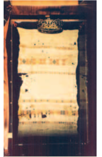
Thánh tích miếng vải có dính Máu khi Richiarella tìm ra Thánh Thể nhiệm màu