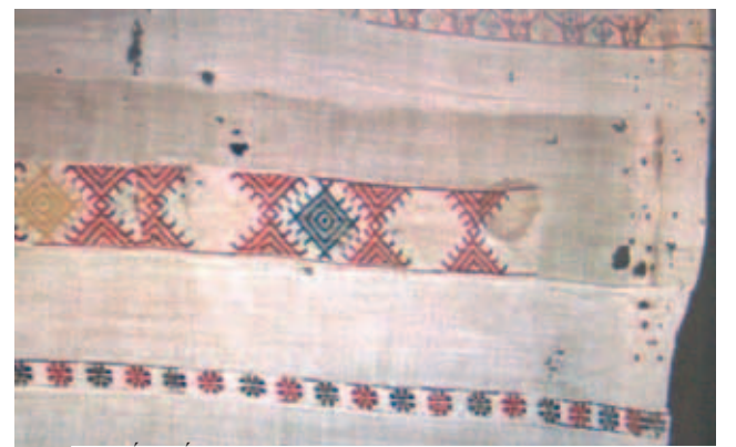
Chi tiết miếng vải dính Máu