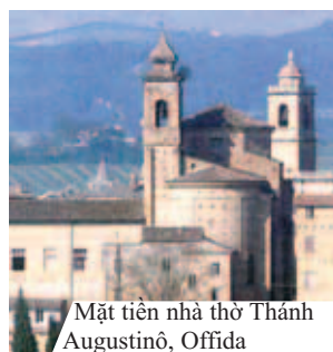
Mặt tiền nhà thờ Thánh Augustinô, Offida