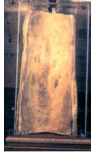
Bình dầu nơi Phép lạ Offida xảy ra